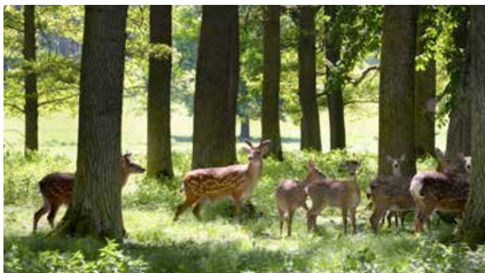
HUBERTIN krmí Lesy České republiky v Oboře Sedlice

Pro objednávky kontaktujte svého obchodního zástupce, vybrané odborné výživáře nebo se obraťte přímo na obchod@mrazagro.cz